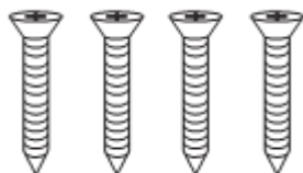
Vrutky 2x18mm – 4ks Pro upevnění instalačního rámečku do zdi